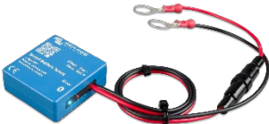
Bluetooth tespiti: Akıllı Akü Hassasiyeti