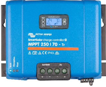
SmartSolar Şarj Kontrol Birimi MPPT 250/70-Tr isteğe bağlı takılabilen ekranla