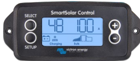
SmartSolar takılabilir ekran

Kontrol biriminin önündeki kapağı koruyan kauçuk mührü çıkarın ve ekranı takın.