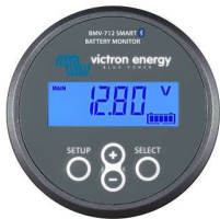
Bluetooth tespiti: BMV-712 Smart Akü Monitörü