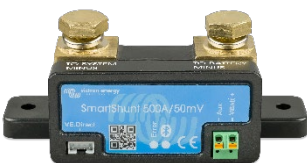
Bluetooth tespiti: SmartShunt