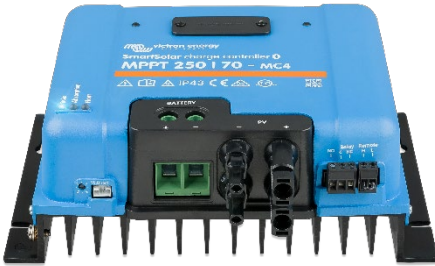
SmartSolar Şarj Kontrol Birimi MPPT 250/70-MC4 ekransız