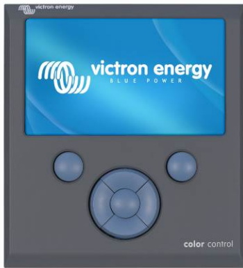
Color Control GX