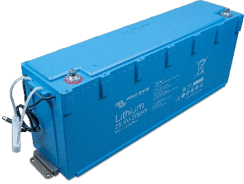
Montaj braketleri ile sabitlenir