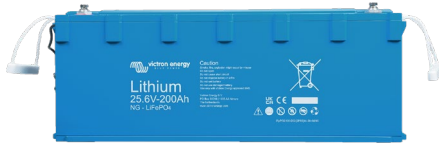
25,6 V 200 Ah Lithium NG akü