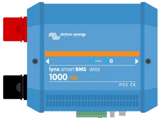
Lynx Smart BMS NG 500 A ve 1000 A