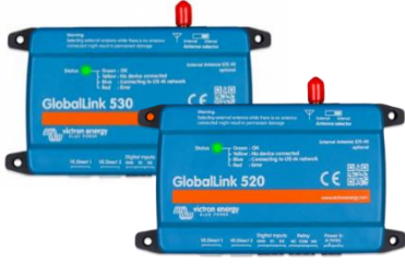
GlobalLink 530 ve 520