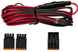
Aksesuarlar dahil GlobalLink 520 ve 530 ile