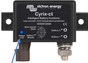
LED durum göstergesi