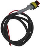
Cyrix-ct 12/24-230 için kontrol kablosu Uzunluk: 1 m