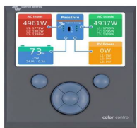
Color Control GX