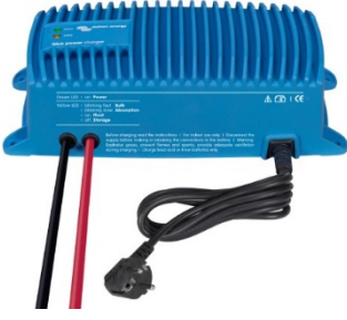
Blue Smart IP67 Şarj Cihazı 12/25